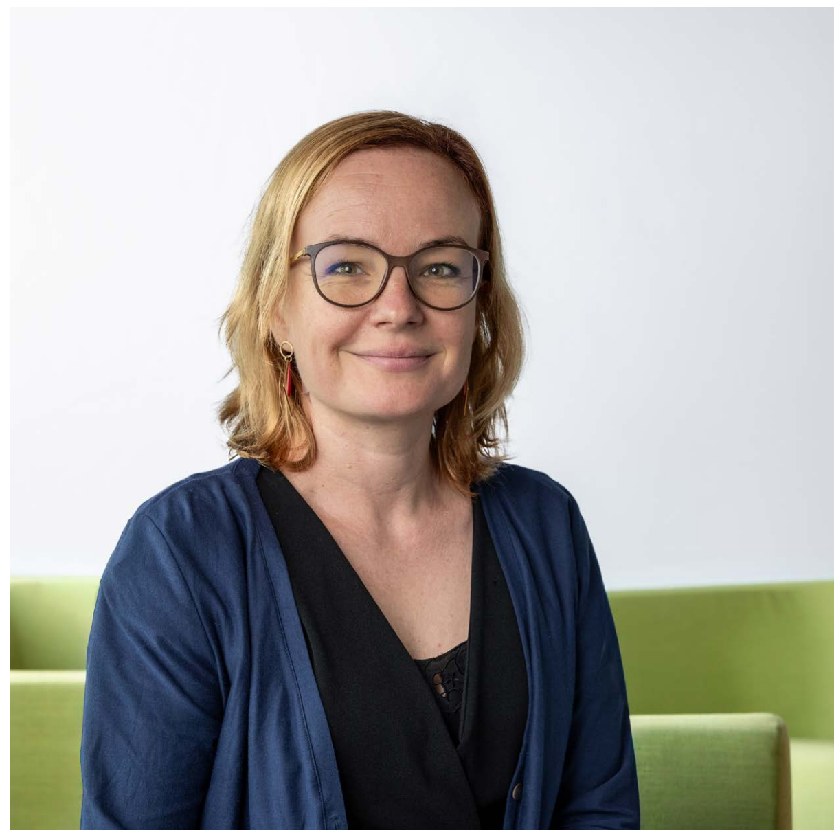
GABRIELA MEDICI CO-DIRECTION DU SECRÉTARIAT DE L'UNION SYNDICALE SUISSE (USS)