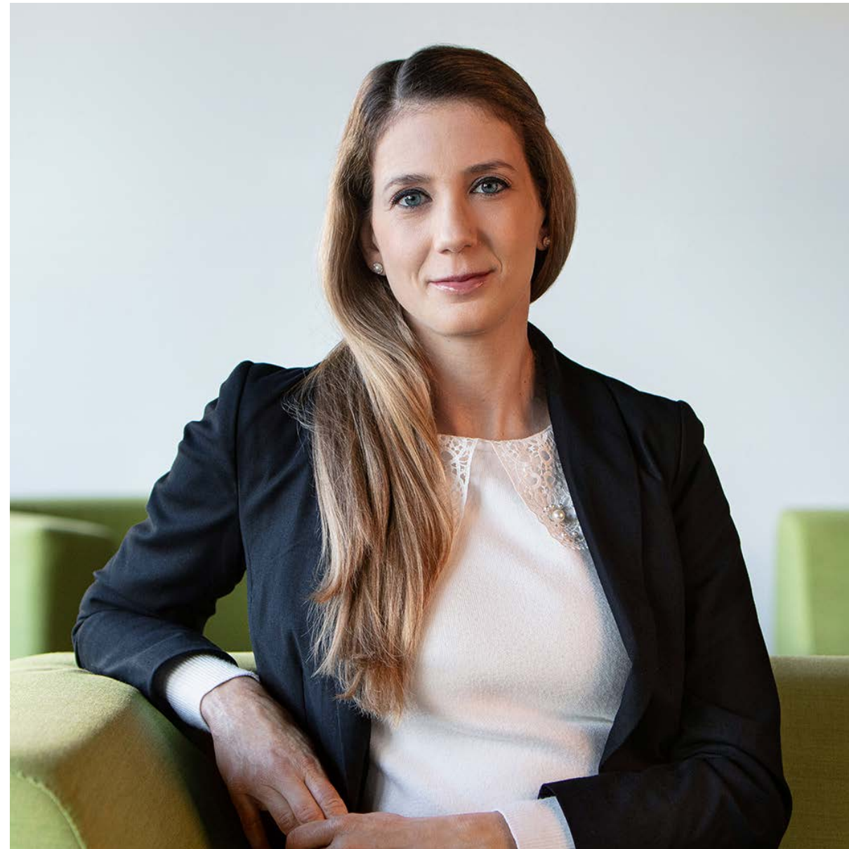
ALEXANDRA MOLINARO REPRÉSENTANTE DE L'OFFICE FÉDÉRAL DE LA SANTÉ PUBLIQUE (OFSP)